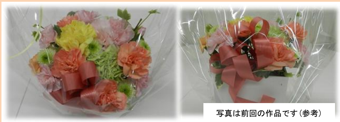
写真は前回の作品です(参考)